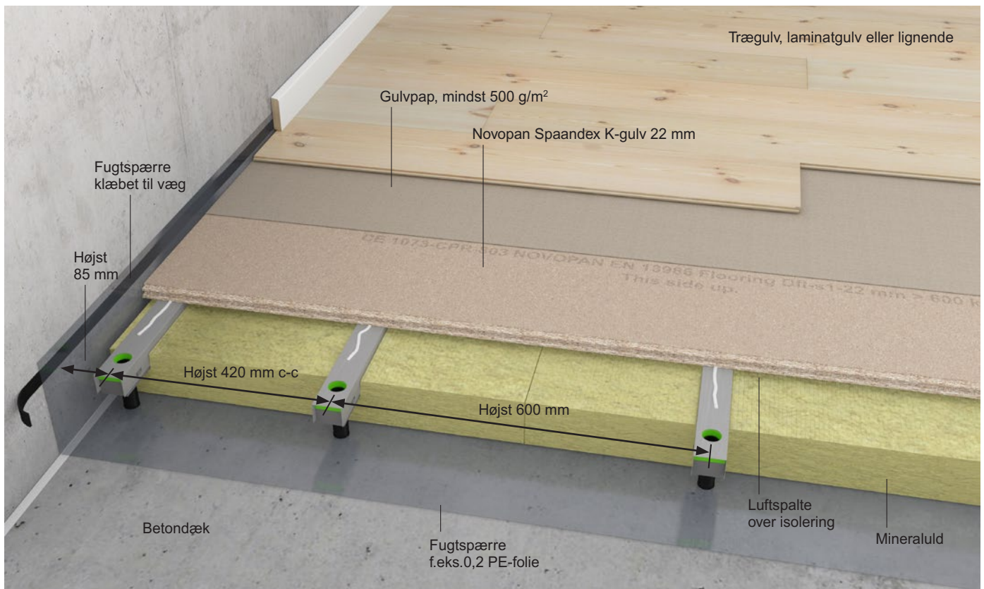
Figur 1 Novopan Spaandex K-gulv 22 mm på stålstrøer – system Granab 7000N. Strølaget udføres med randstrøer langs alle vægge og en strøafstand i afstanden i første fag langs væg på 420 mm c-c.

Hvor gulvbelægnings fuldklæbes til Spaandex K-gulve, skal gulvpladerne være klæbet og skruet til stålstrøerne.